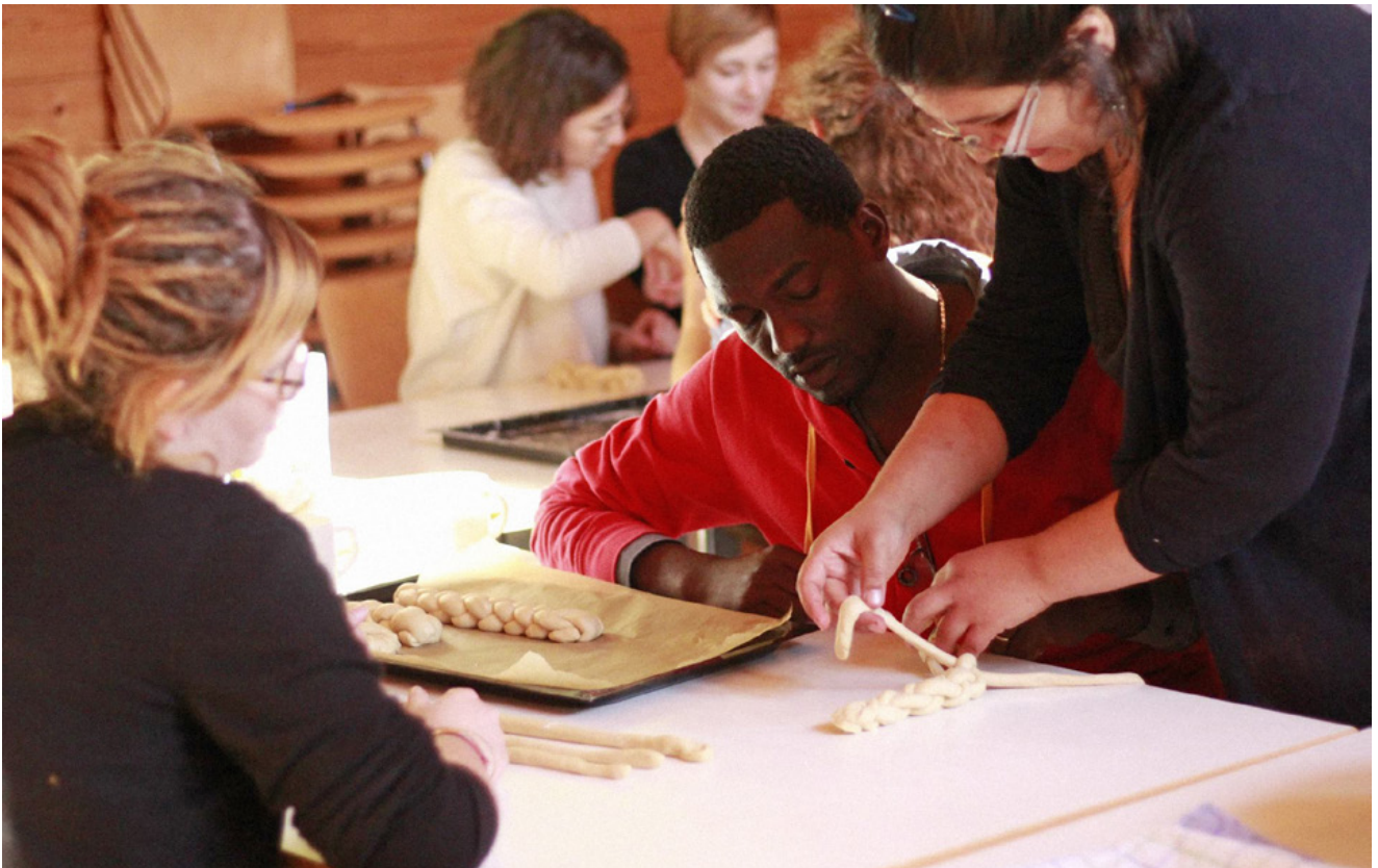
Slow Food Aktivist*innen beim Diskutieren und Backen