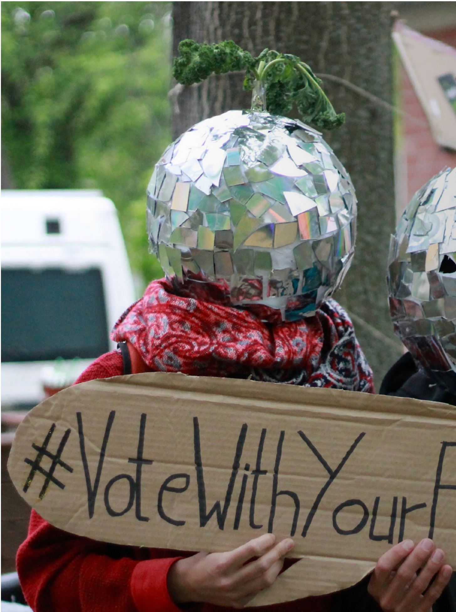
Eine diverse Gesellschaft stellt politische Bewegungen vor die Aufgabe, Protest kreativ und offen zu gestalten.